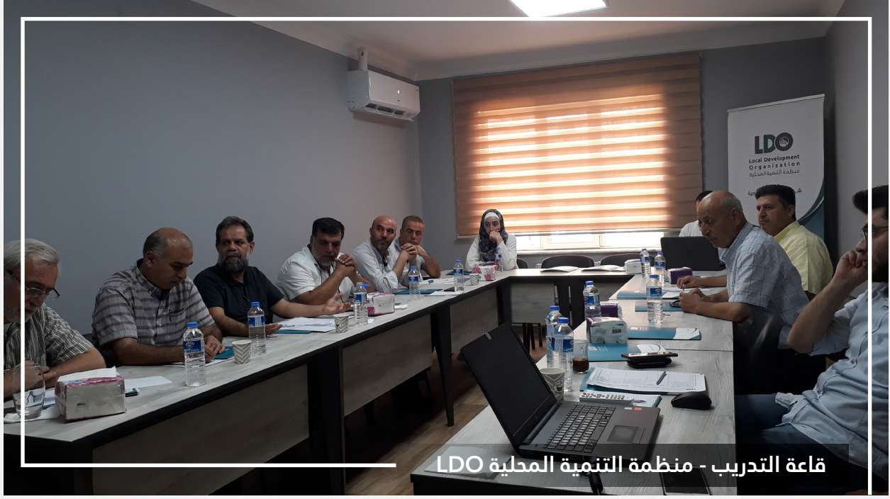
قاعة التدريب - منظمة التنمية المحلية LDO