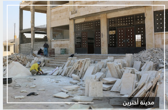
تأهيل وترميم مدرسة الشهداء

كما عمل المجلس المحلي على استبدال خطوط الصرف الصحي في الحي الشمالي من المدينة بالتعاون مع مركز الدفاع المدني.