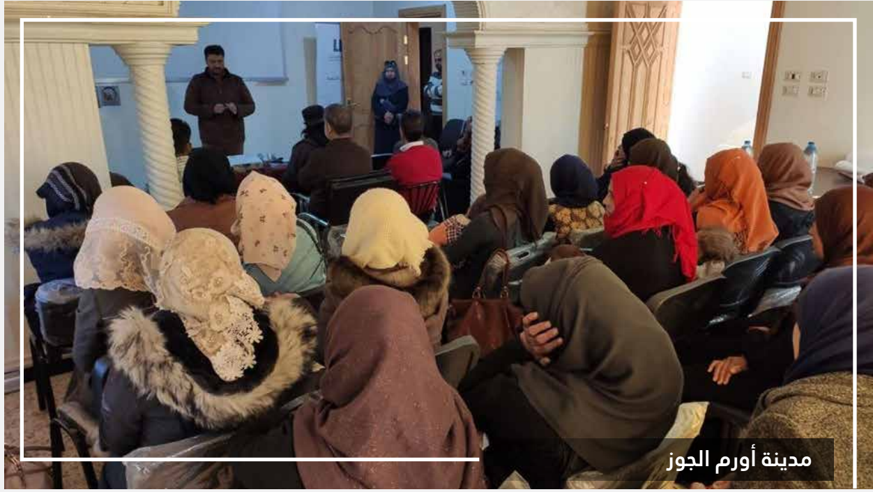
مدينة أورم الجوز