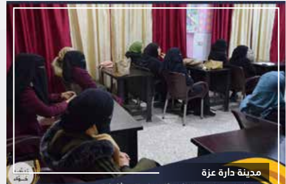
مدينة دارة عزة

أقامت منظمة حواء في دارة عزة حزمة من دورات الحاسب للنساء بهدف تنمية ورفع قدرات المرأة.