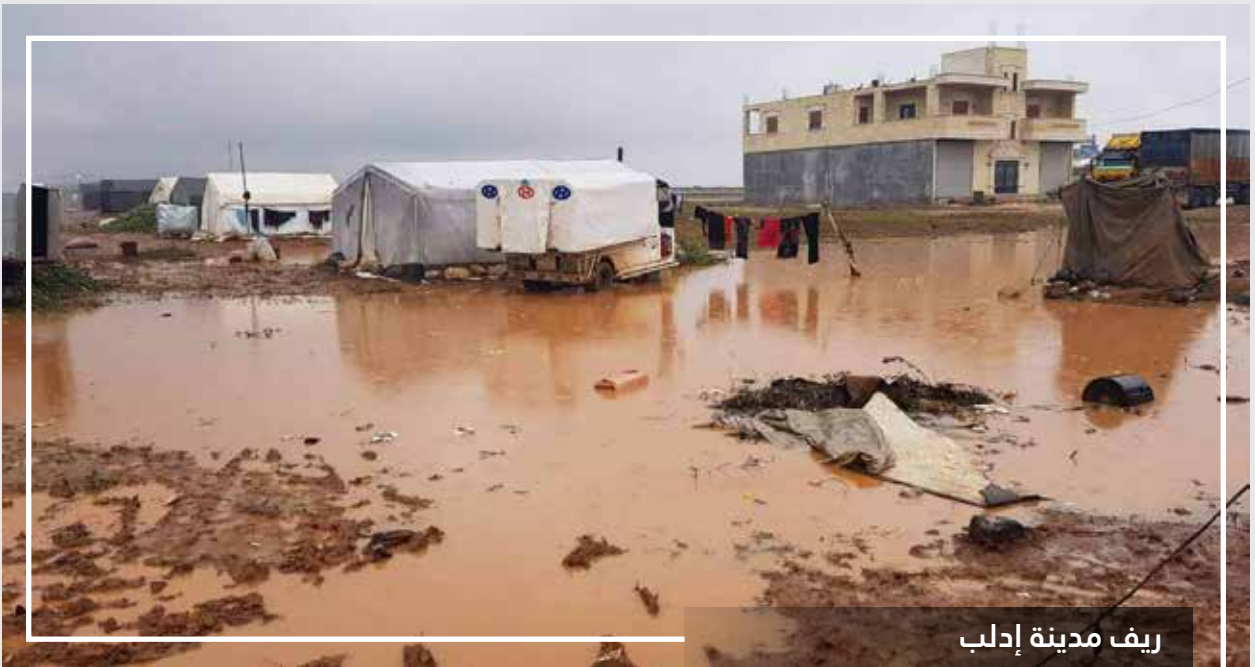
ريف مدينة إدلب

شهدت مناطق الشمال السوري حملة عسكرية لقوات النظام وروسيا على مناطق ريف إدلب الجنوبي والجنوبي الشرقي بدأت الحملة مع بداية شهر تشرين الثاني حتى يومنا هذا نزح نتيجة الحملة ما يقارب 40,117 عائلة ( 216,632 ) نسمة من مناطقهم المذكورة أعلاه، توزعوا على 249 بلدة ومخيم وقرية، منذ بداية الحملة في 1 تشرين الثاني حتى 25 كانون الأول الحالي، حالات النزوح كانت صعبة للغاية بسبب استهداف الطرق الرئيسية بالقصف الجوي المكثف وضعف حركة المواصلات لعدة أسباب أهمها التخوف من القصف وندرة المحروقات، كان هناك إحاطة لل (OCHA بهذا الخصوص عن الوضع الإنساني تكلمت فيها عن صعوبة النزوح من المناطق التي تشهد القصف المكثف وعن رغبة الأهالي بالانتقال إلى مناطق أكثر أمناً أصدرتها في 21 كانون الأول 2019 ، ذكرت من خلالها أن توقف مؤقت للغارات الجوية في 21 كانون الأول بين الساعة 6 صباحاً حتى الساعة