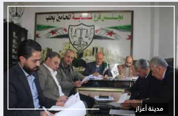
اجتماع فرع نقابة المحامين

عقد مجلس فرع نقابة المحامين الأحرار في حلب جلسته العادية السابعة والخمسون في مقر المجلس بمدينة اعزاز وقام فيها بتدقيق العديد من طلبات المنتسبين الجدد لمجلس الفرع وإحالتها إلى اللجنة المختصة لاستيفاء شرائطها الشكلية والموضوعية.