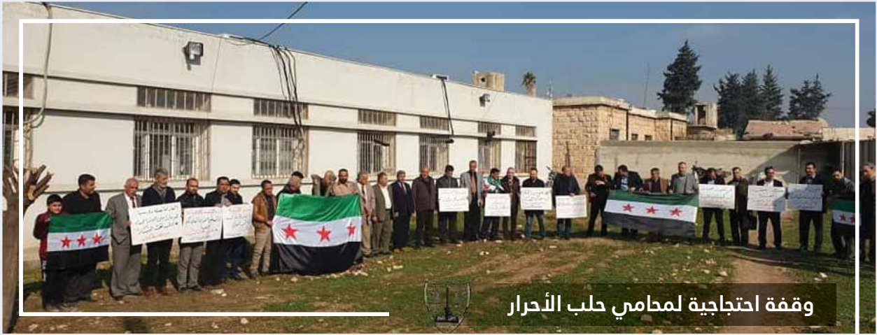
وقفة احتجاجية لمحامي حلب الأحرار

بمشاركة مجالس فروع نقابة المحامين الأحرار في كلٍّ من حلب - حمص - حماه - دمشق - درعا - اللاذقية - الرقة - الحسكة، عقد المحامون الأحرار في الجمهورية العربية السورية مؤتمرهم الانتخابي الأول في المركز الثقافي في مدينة إعزاز بتاريخ السبت ٢١ / كانون الأول / ٢٠١٩ لانتخاب النقابة المركزية الممثلة للفروع. عقد مجلس فرع نقابة المحامين الأحرار في حلب جلسته العادية الثالثة والستون في مقر المجلس بمدينة إعزاز، بتاريخ الاثنين الموافق ١٣ / كانون الثاني / ٢٠٢٠ حيث استعرض المجلس جدول الأعمال المقدم من رئيس وأعضاء المجلس ، واتخذ قرارات وفق قانون تنظيم مهنة المحاماة كما تم إقرار خطة جولات