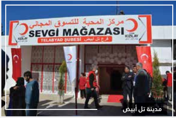
مدينة تل أبيض

أطلق المجلس المحلي مع مجموعة من الفعاليات الاجتماعية مبادرة لجمع التبرعات العينية والمادية بغية تأمين ما يلزم لنازحي معرة النعمان وريفها.