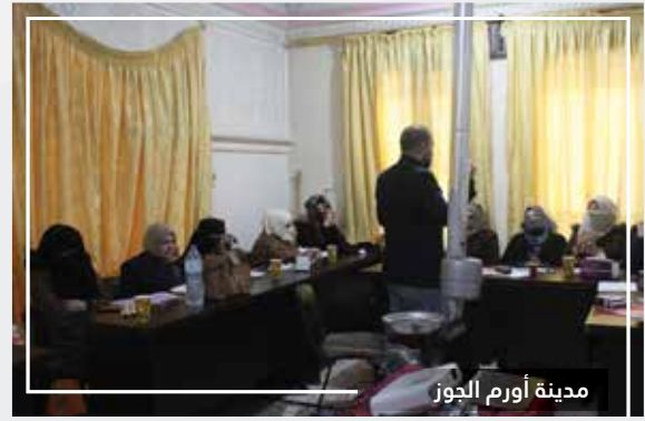
مدينة أورم الجوز

أطلقت منظمة التنمية المحلية المرحلة الثانية من مشروعها صوت المرأة في مدينة أورم الجوز وقد أطلقت حتى الآن دورتي أساسيات الدعم النفسي الاجتماعي مهارات التيسير