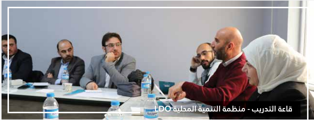
قاعة التدريب - منظمة التنمية المحلية LDO

بالتعاون مع جمعية تأهيل المرأة والطفل. دورة في المراقبة والتقييم و دورة في مهارات التصوير والإعلام في كفرناها بالتعاون مع جمعية رائدات.