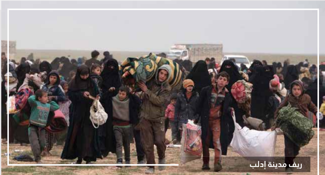
ريف مدينة إدلب

تعتبر المساعدات الإنسانية الفورية أهم ما يحتاجه النازحون في الشمال السوري، حيث أصبح الغذاء وتأمين المأوى وكذلك الدعم الصحي والنفسي الاجتماعي حاجة ملحة للنازحين حصص الطعام الجاهزة والوجبات