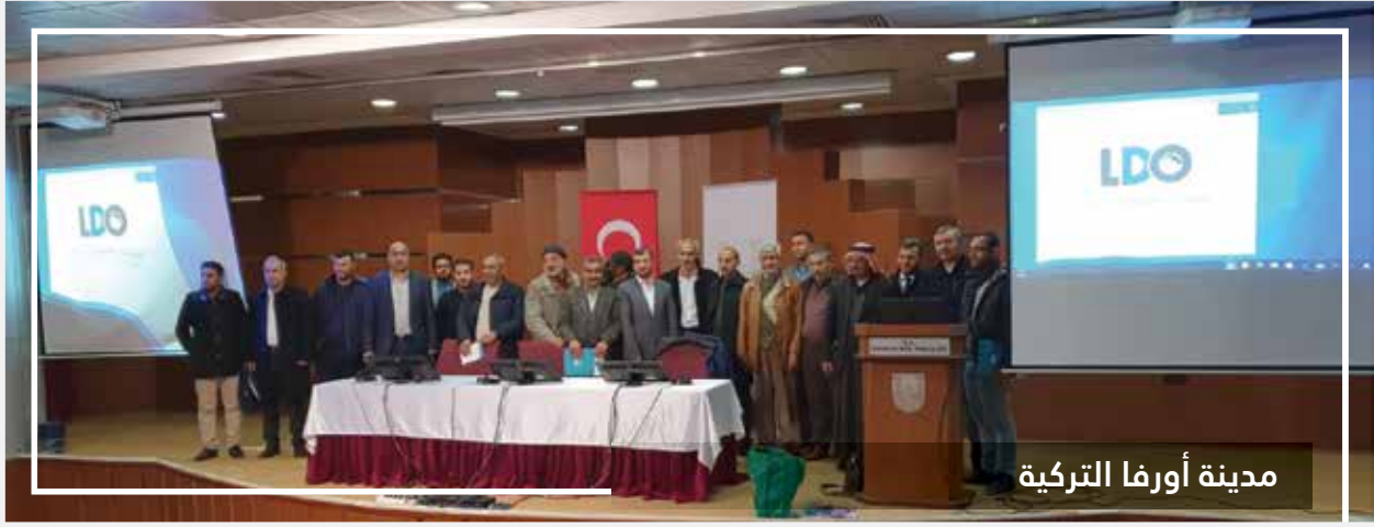
مدينة أورفا التركية